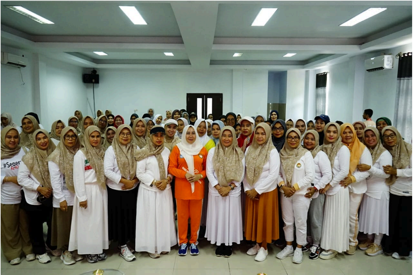
Foto Bersama Pengurus dan Anggota DWP Kolut