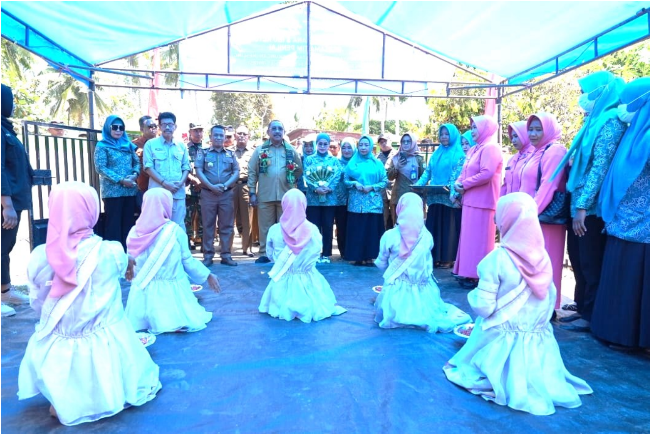
Rombongan Pj. Bupati Bombana saat dilakukan penyambutan

Pj. Bupati menambahkan bahwa lomba ini tidak hanya tentang prestasi semata, melainkan tentang menciptakan generasi masa depan yang berkualitas dan berdaya saing tinggi, sejalan dengan visi Generasi Emas 2045.