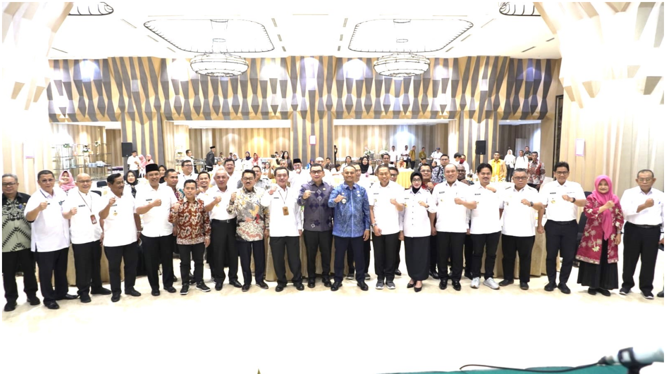
Foto Bersama usai Kegiatan