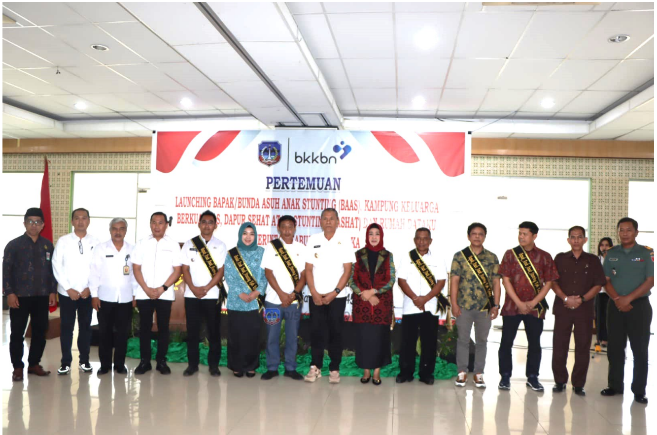
Foto Bersama usai pelaksanaan kegiatan