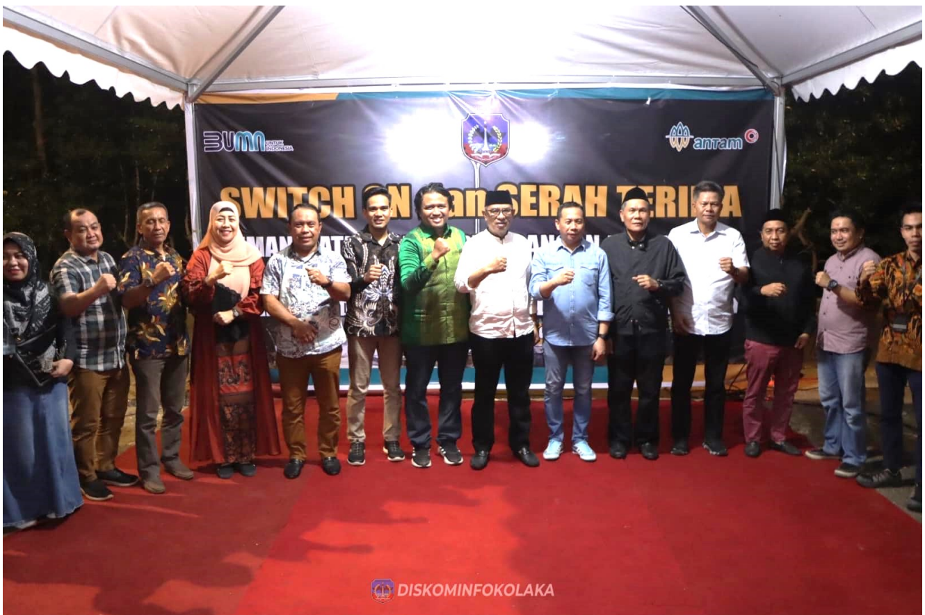
Foto Bersama usai Serah terima PJU di Pomalaa

“Manfaat yang luar biasa ini dapat dirasakan oleh warga Kolaka, khususnya masyarakat Pomalaa,” ujar Bupati.