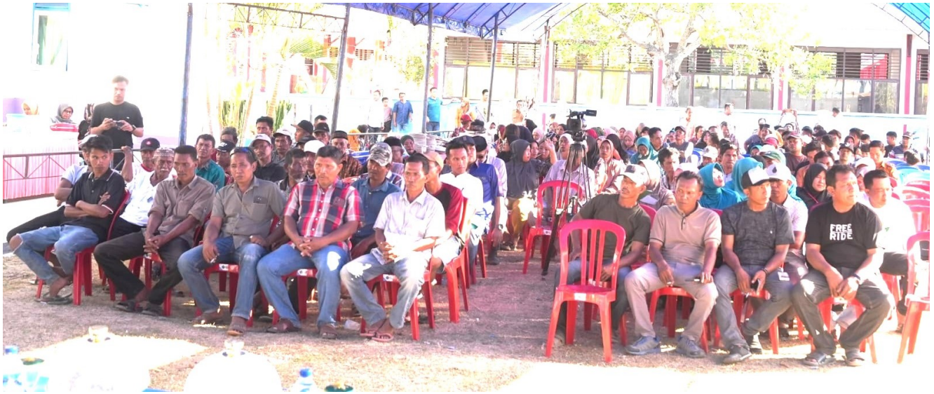
Masyarakat Poleang Tenggara yang menghadiri Pertemuan

Melalui kegiatan silaturahmi ini, Pj. Bupati Bombana tidak hanya memenuhi janji-janji kepada masyarakat, tetapi juga membuktikan keseriusannya dalam membangun kerjasama yang harmonis untuk kemajuan Kabupaten Bombana. (*)