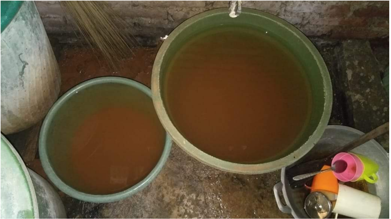
Kondisi Air Keruh di Desa Balo