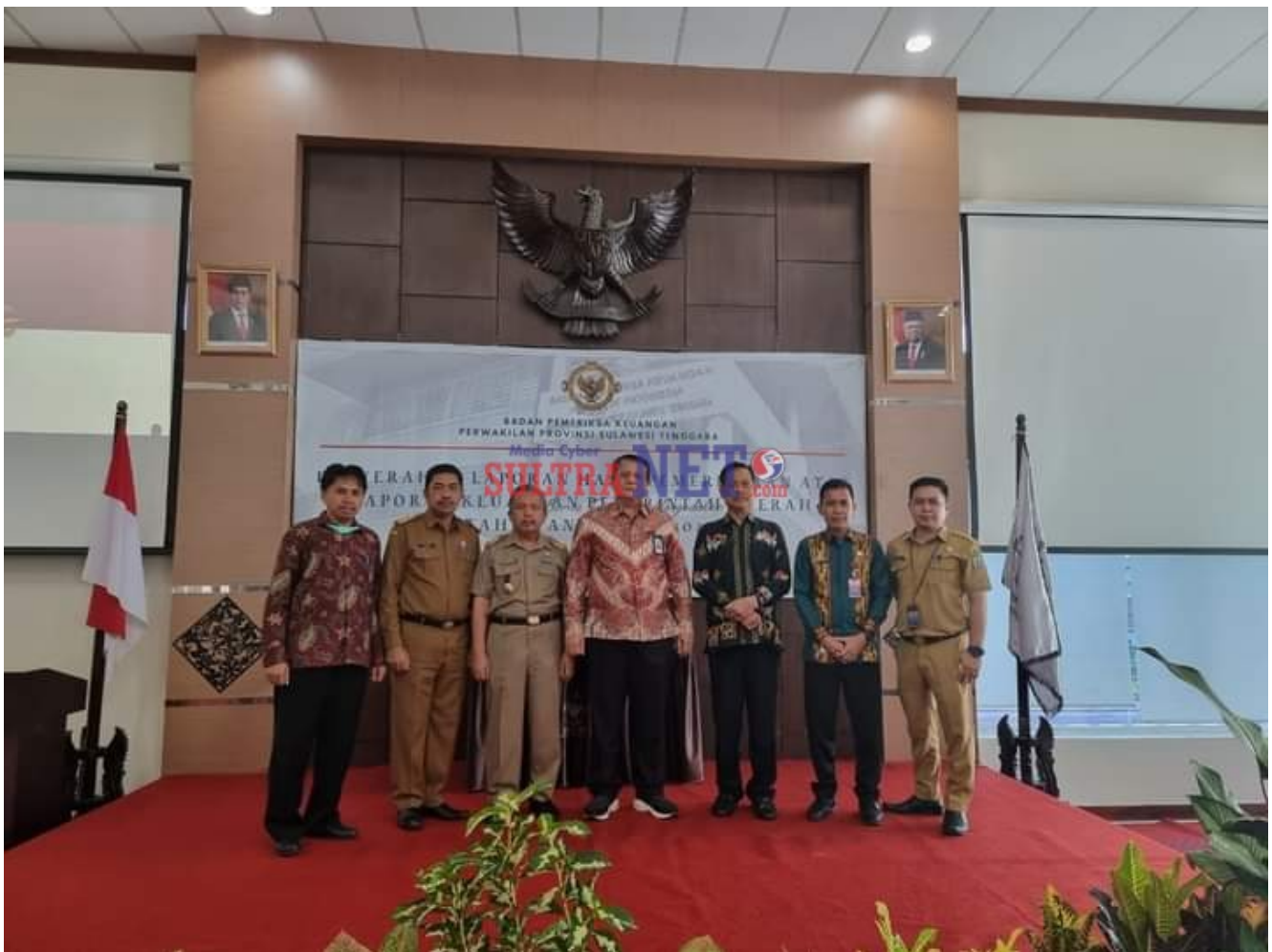
Foto bersama usai Penyerahan Penghargaan