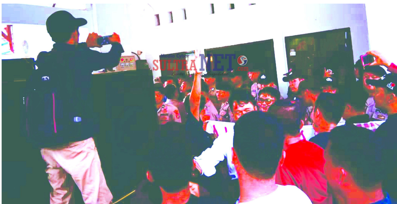
Massa Aksi G-30S-PK saat orasi di Kantor DPRD Bombana