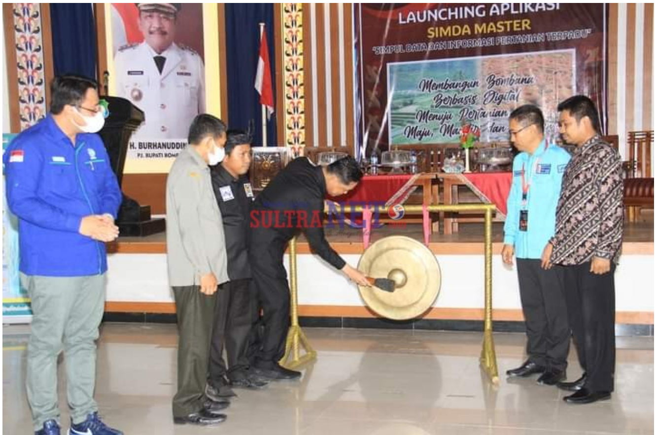
Pemukulan Gong Peluncuran Aplikasi Simda Master

Ia menyebut sumber data dan informasi pertanian dalam Simda Master bersumber dari stakeholder Promoters yang mempunyai pengaruh besar dan kepentingan besar, sehingga informasi yang diperoleh menjadi akurat dan terpercaya.