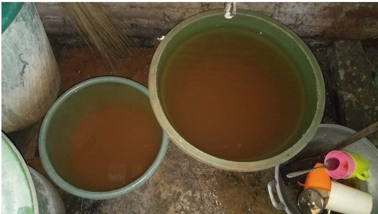
Kondisi Air Keruh di Desa Balo

dampak keruhnya air bersih warga Desa Balo yaitu dengan menjaminkan kebutuhan air bersih masyarakat kedepannya dapat terpenuhi sebagaimana yang diamanatkan Undang-Undang No. 40 Tahun 2007 tentang Perseroan Terbatas dan Keputusan Menteri Energi dan Sumber Daya Mineral Republik Indonesia Nomor 1827 K/30/MEM/2018 Tentang Pedoman Pelaksanaan Kaidah Pertambangan yang Baik.