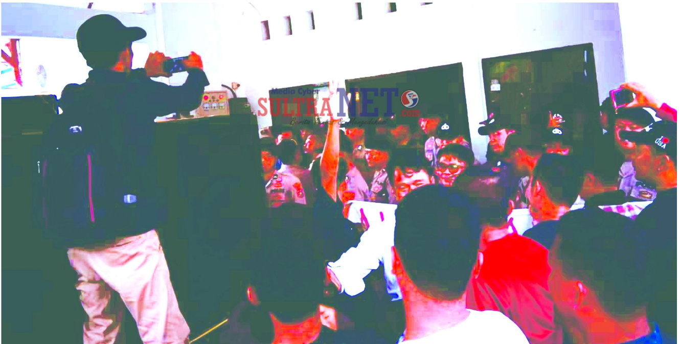
Massa Aksi G-30S-PK saat orasi di Kantor DPRD Bombana