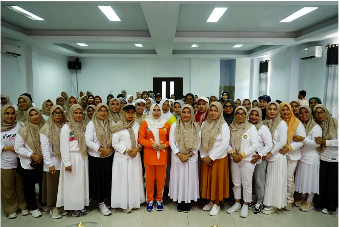
Foto Bersama Pengurus dan Anggota DWP Kolut

“Silaturahmi seperti ini menjadi sarana yang baik untuk menjaga kebersamaan dan meningkatkan solidaritas di antara kita. Melalui kegiatan ini, kita dapat saling mendukung dan memperkuat kontribusi kita,” ujarnya.