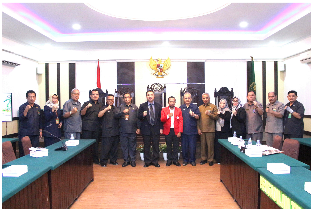
Foto bersama usai penandatanganan MoU