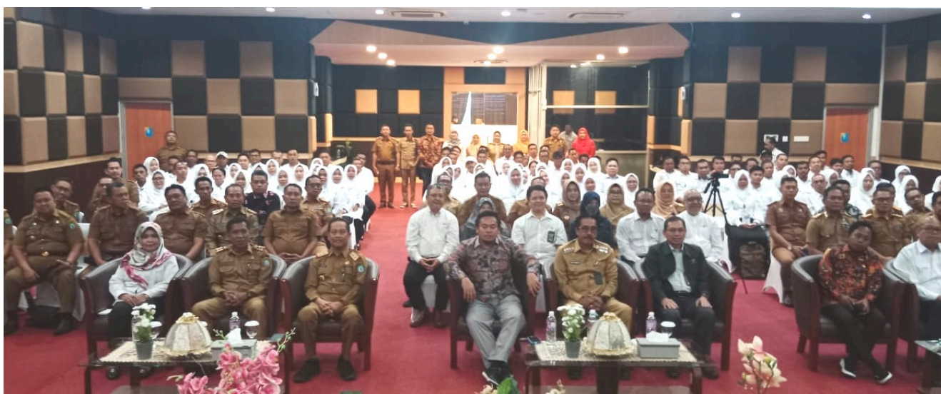
Suasana Pembukaan Kegiatan Diklat