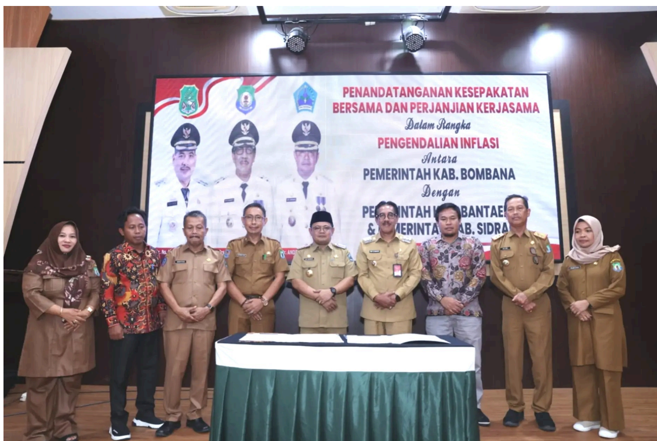
Foto bersama usai penandatanganan MoU