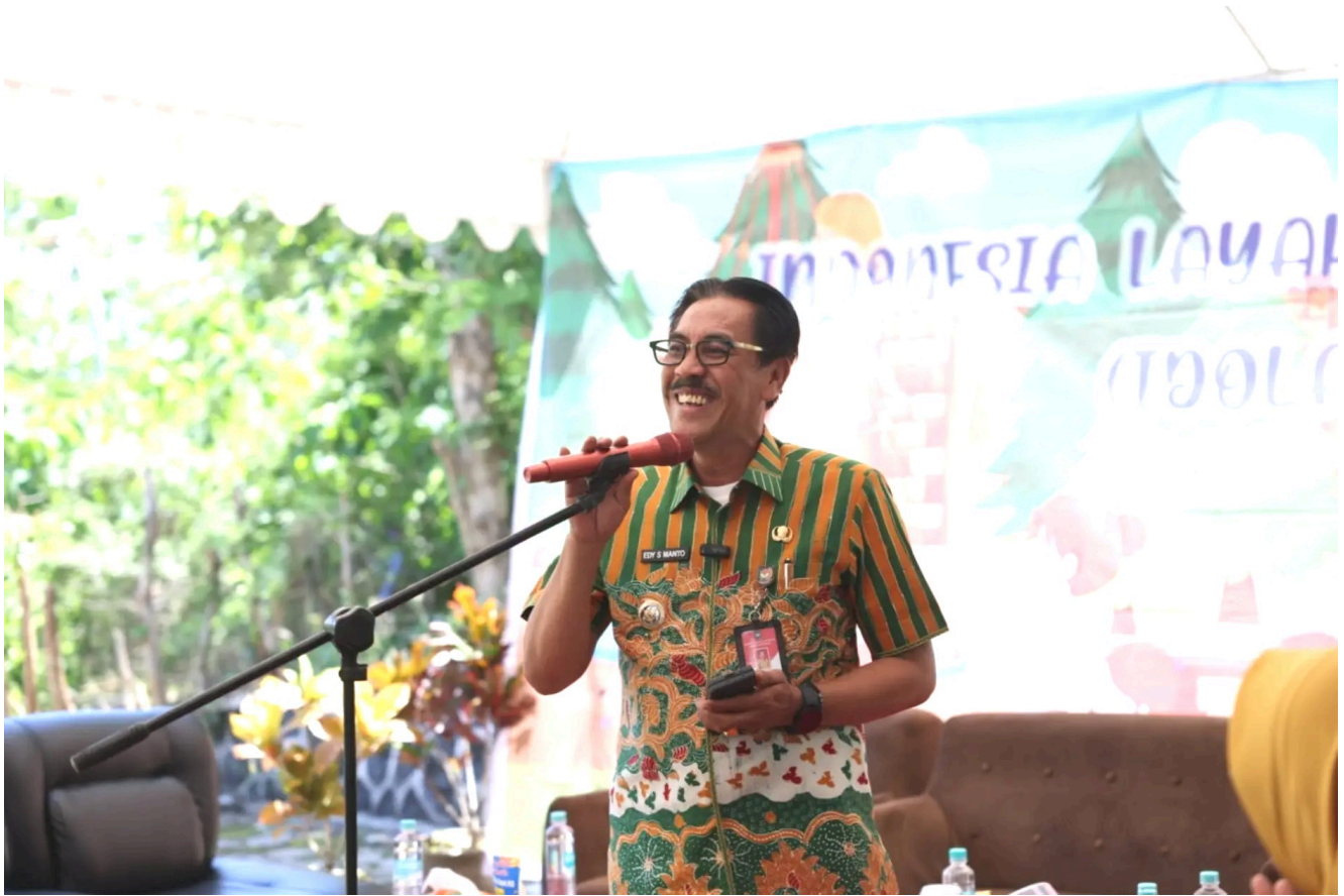
Pj. Bupati Bombana Edy Suharmanto

Pada momen perpisahan tersebut, Sitti Sapiah tak lupa menyampaikan ucapan terima kasih kepada seluruh jajaran Dinas DP3A, rekan kerja, dan masyarakat Kabupaten Bombana yang telah memberikan dukungan sepenuhnya selama masa kepemimpinannya.