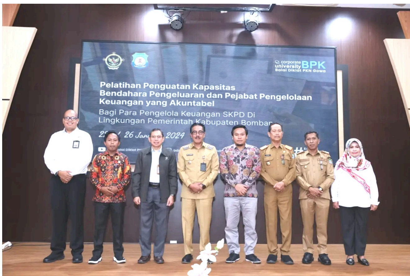
Foto Bersama Stakeholder terkait

Pj. Bupati menegaskan pentingnya peningkatan transparansi dan akuntabilitas di bidang pengelolaan serta pertanggungjawaban keuangan SKPD. Hal ini diharapkan dapat menciptakan pengendalian manajemen yang lebih efektif dan efisien.