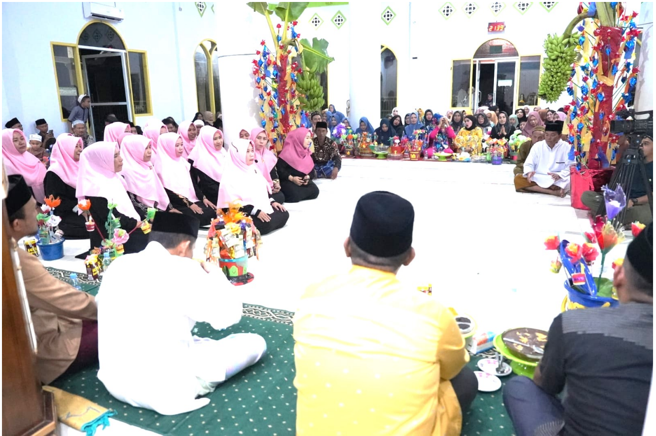
Suasana Maulid Nabi Muhammad SAW