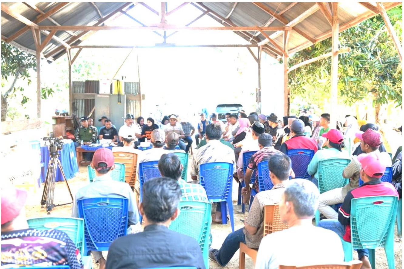
Pj. Bupati Bombana saat berdialog dengan Warga Rarowatu Utara

Pj. Bupati juga mengajak seluruh camat di lingkup Pemerintah Kabupaten Bombana untuk konsisten dalam menjalankan tugas, fokus pada satu titik, dan terus memantau serta memahami permasalahan masyarakat. Beliau menegaskan bahwa pemerintah harus selalu peduli terhadap kebutuhan masyarakat.