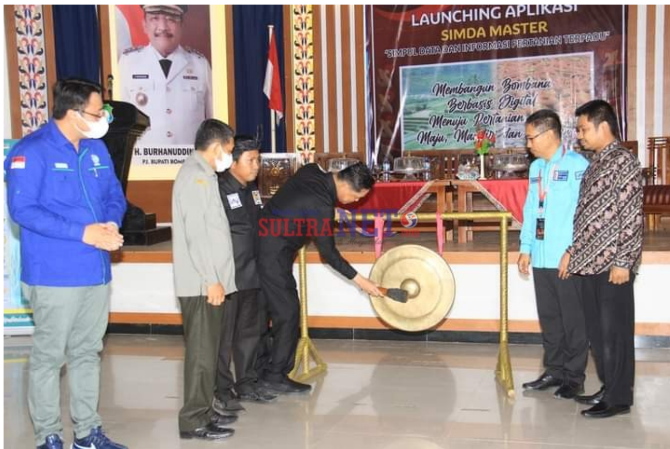
Pemukulan Gong Peluncuran Aplikasi Simda Master