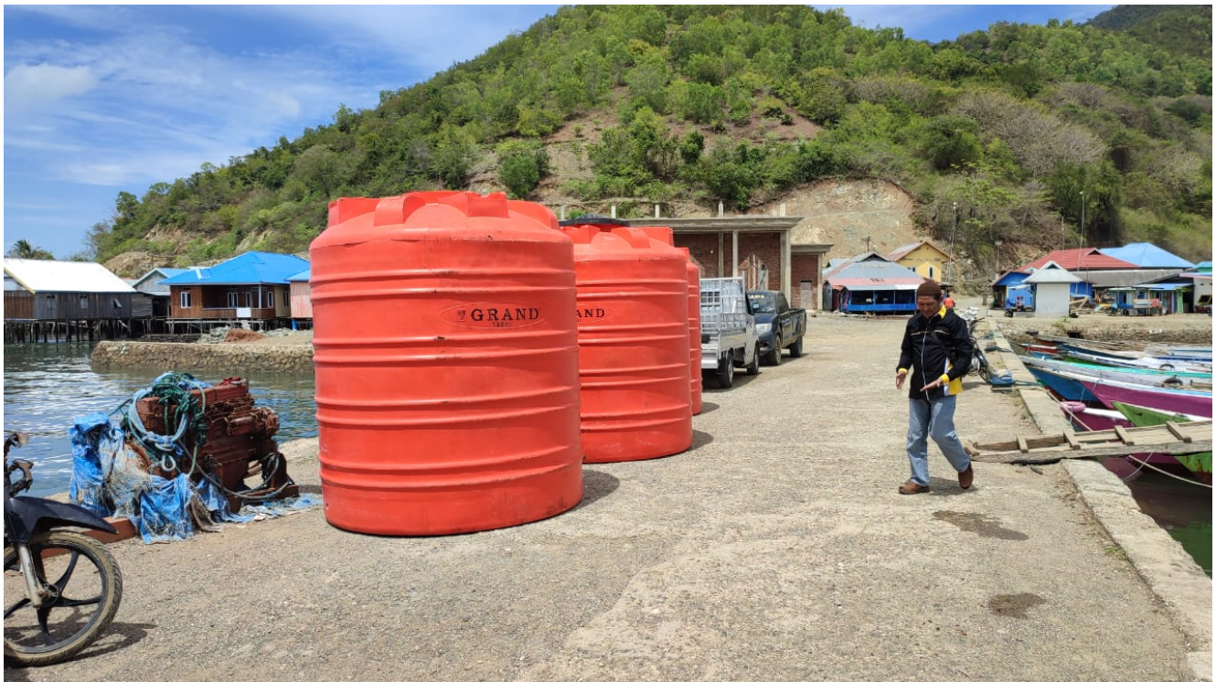
Bantuan Tendon Air

“Perbaikan Sumber Air bersih Warga sementara dilakukan,” Ujar Maulana Purnomo