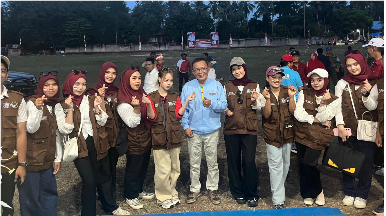
Foto Bersama Wakil Bupati Konawe Seusai Kegiatan