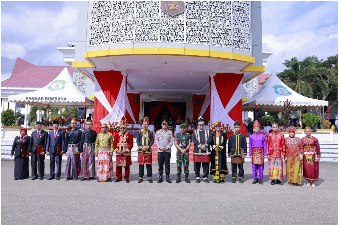
Foto bersama Forkopimda Bombana

Ia juga menekankan bahwa pendidikan merupakan salah satu prioritas utama sesuai dengan Asta Cita Presiden Prabowo Subianto. Pemerintah pusat berkomitmen memutus mata rantai kemiskinan melalui peningkatan kualitas pendidikan, termasuk revitalisasi sarana prasarana, pembelajaran digital, dan peningkatan kesejahteraan serta kompetensi guru.