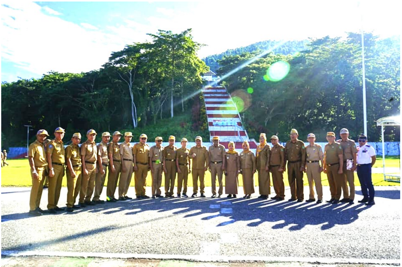
Foto bersama usai pelaksanaan Apel