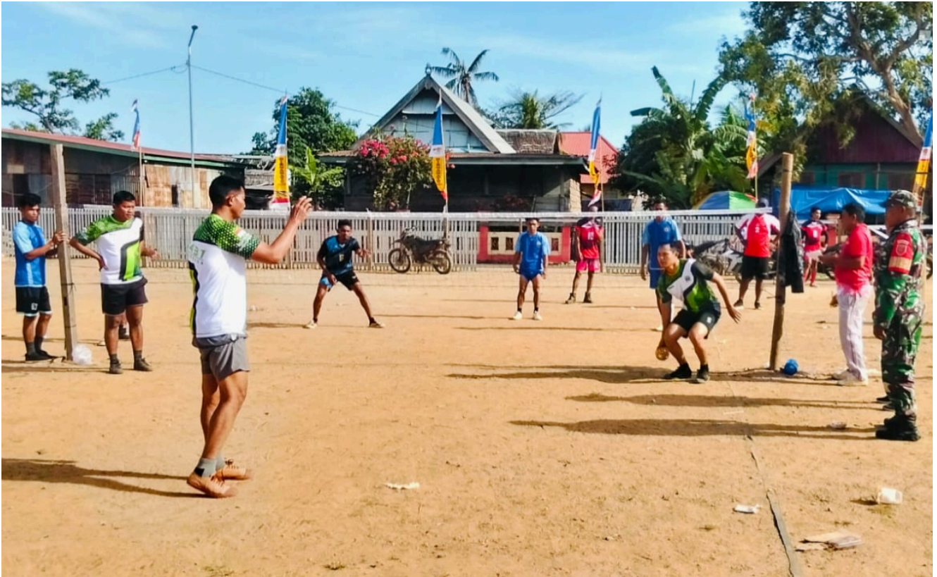
Pertandingan Tim Takraw Koramil Kabaena melawan Tim Takraw Desa Batuawu