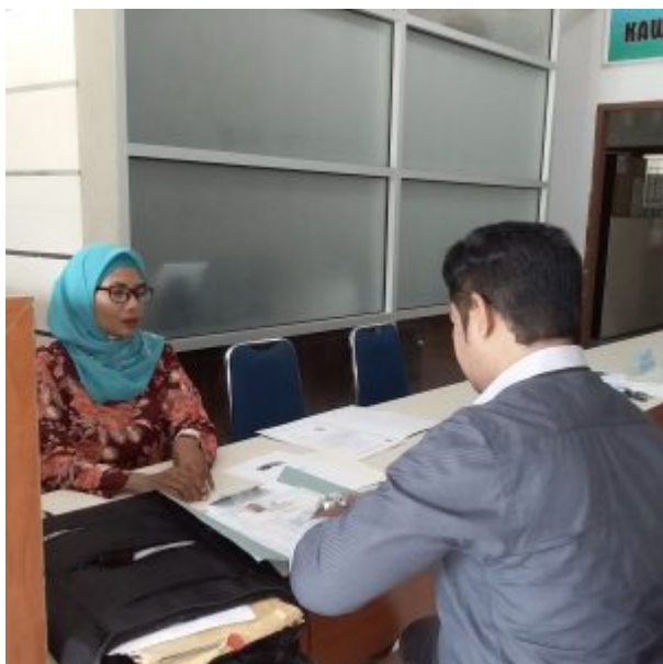
Proses Pelayanan Perizinan