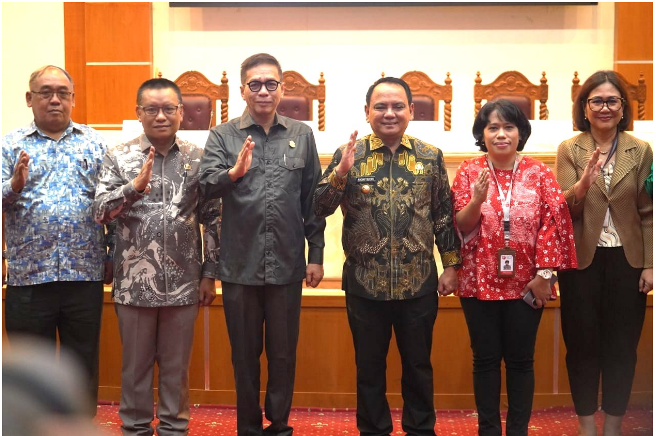
Foto Bersama usai pelaksanaan Rakor

Utara, dengan keterlibatan warga desa sebagai enumerator. Proyek ini memperoleh dukungan finansial sebesar Rp 639.999.360, dengan 65% dari anggaran digunakan untuk pelatihan, FGD, honorarium enumerator, dan sejenisnya, serta 35% digunakan untuk operasional lainnya,"Jelasnya.